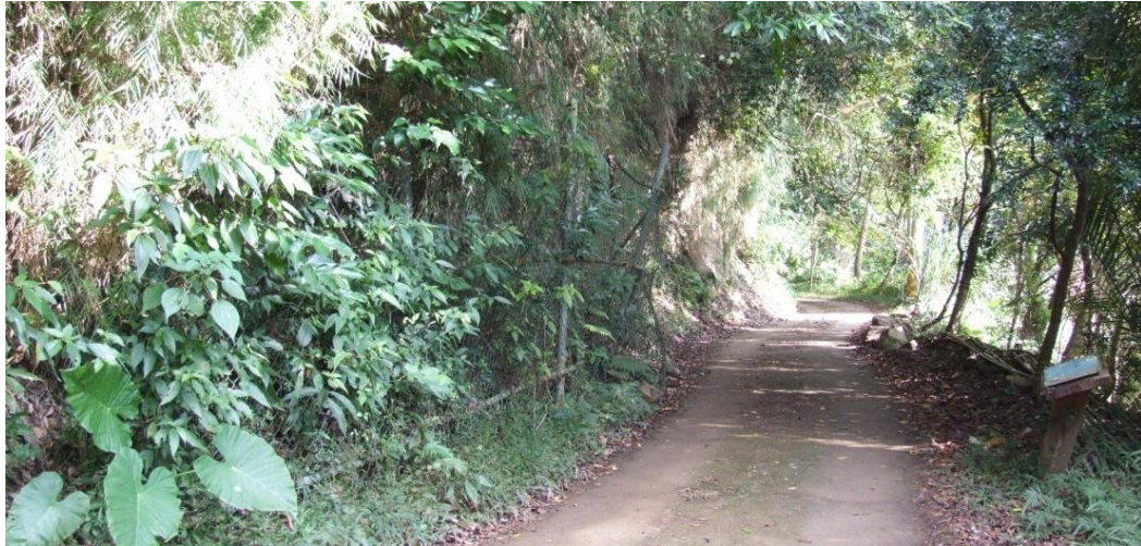
圖二 蘇鐵化石區環境

南庄蘇鐵化石區全長約 100 公尺，由北而南恰為台電之電線幹之白雲幹 51 支 17(D9647, BB44)、白雲幹 51 支 20(D9647, CA48)，起迄座標為 (24. 614571, 120. 985747)、(24. 614293, 120. 986301)。